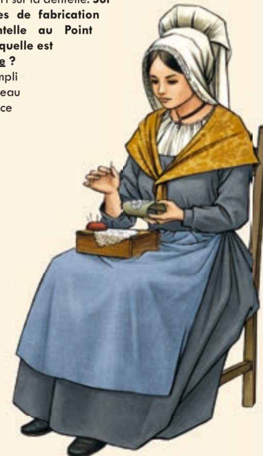
Dentellière à l'ouvrage au Point d'Alençon