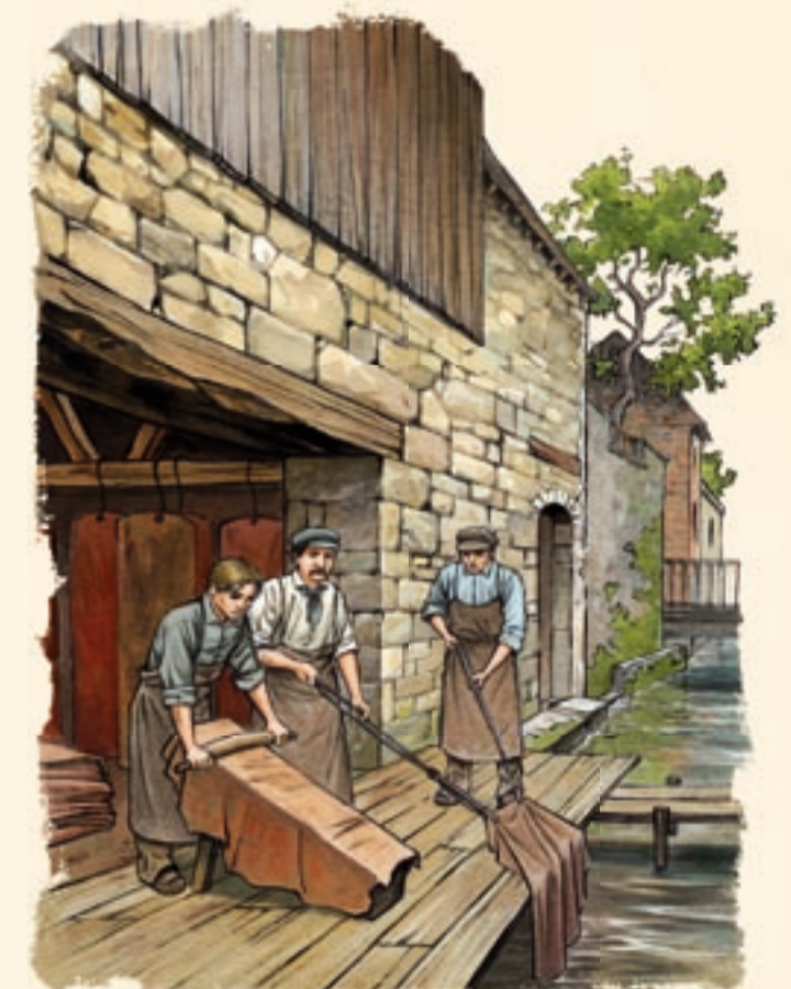
Tanneurs au travail sur la Briante