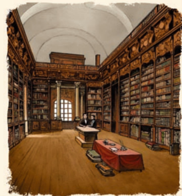
Intérieur de la bibliothèque